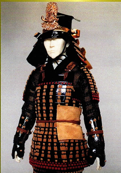
当社開発創作甲冑「最上胴具足」(1/4スケール)

※当社の取り組みは文化創造事業として高い評価を頂き、厳正な選考により埼玉県より平成13年度経営革新企業に認定されました。