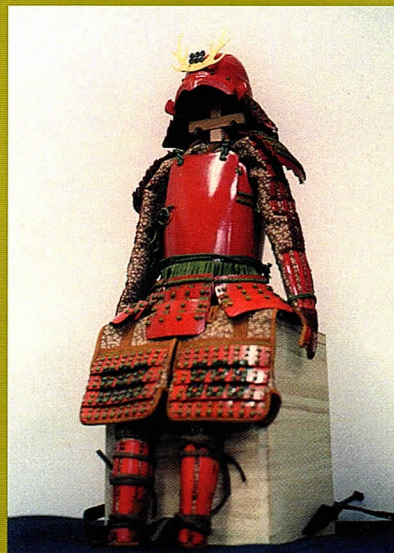
当社開発創作甲冑「伝胴当世具足」(1/4スケール)